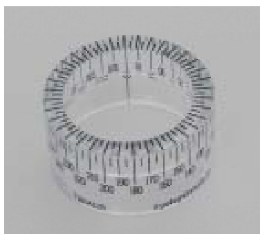
< T161A12B >

下記の特注品に対応いたします。価格・納期等はお問い合わせ アクリル樹脂リングの形状（寸法変更） 側面フィルムのデザイン変更（角度数値の位置変更など）