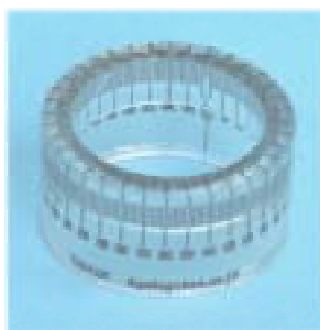
< T161A13C >

下記の特注品に対応いたします。価格・納期等はお問い合わせ アクリル樹脂リングの形状（寸法変更） 側面フィルムのデザイン変更（角度数値の位置変更など）