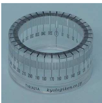
< T161A21A >